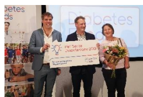
Escaperoom Hyper Control

Mocht je toch nog vragen hebben, neem dan gerust contact met ons op.