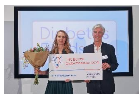
De DiaTechExpect kaart

Daarnaast stellen twee eerdere winnaars hun succesvolle aanvraag beschikbaar als voorbeeld.